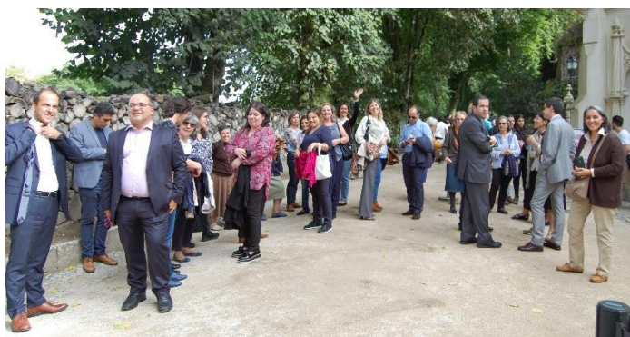
visita à Quinta da Regaleira

Mais tarde, Irmãs e Leigos reuniram-se em grupos de trabalho, analisando e discutindo propostas de ação para os próximos seis anos. Momento profícuo e democrático deu a todos a possibilidade de participar no documento que emana as orientações gerais que nos regerão durante o próximo sexénio. No final do dia, o sentimento de missão preenchia o semblante de cada participante.